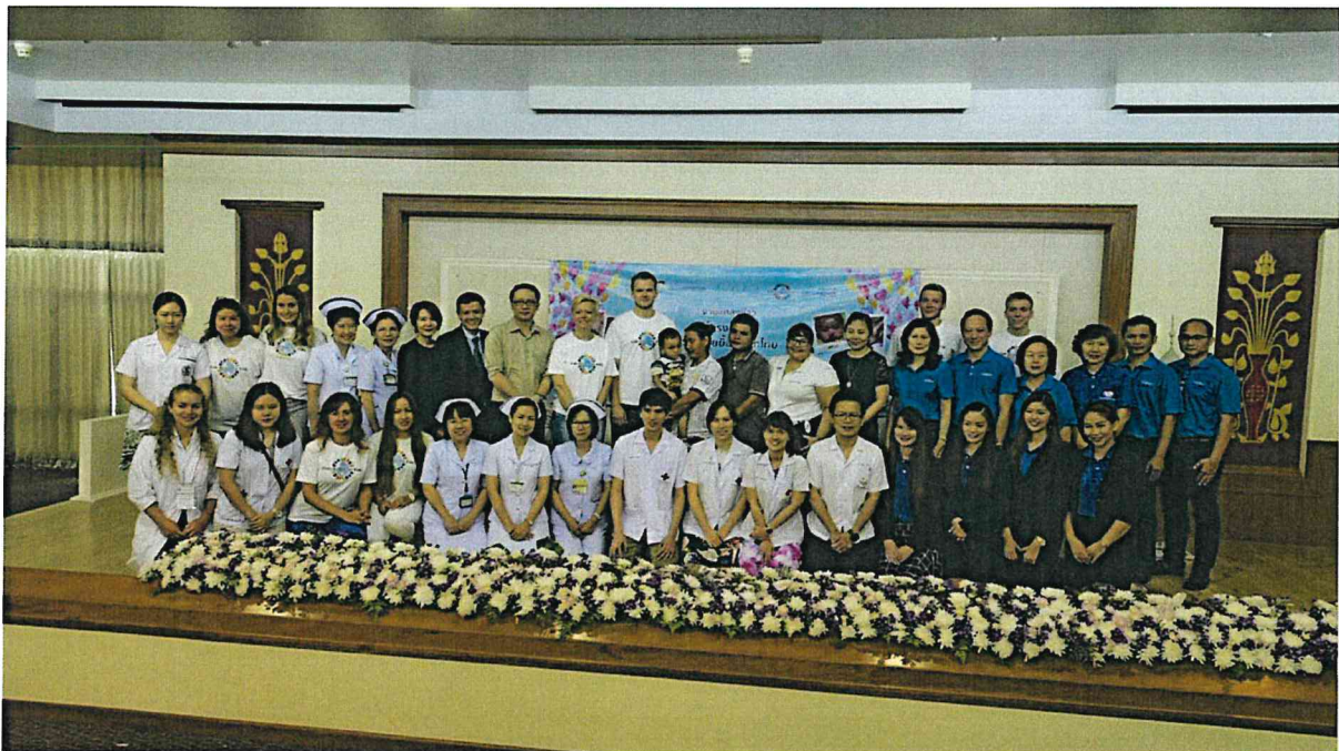
Bildetektst: Bilde fra video møte for å markere starten på medical mission i Chiang Mai i Oktober 2021 (første bildet), samt minner i fra tidligere medical missions ved samme sykehus i 2016 og 2019.