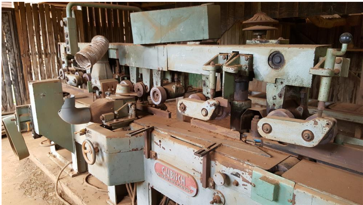
Maskinen som ble reparert på yrkesskolen

I løpet av 2017 har BFA også støttet en yrkesskole i Burhuza, øst i Kongo. Fagskolen som utdanner bilmekanikere, snekkere og murere hadde også en egen butikk hvor de solgte det som ble laget for å finansiere skoledriften. Under krigen ble skolen okkupert av en opprørsgruppe i flere måneder. Skolen ble delvis plyndret og materiell og utstyr ble ødelagt, noe som medførte at skolen mistet en viktig inntektskilde og undervisningsmulighet. BFA valgte derfor å finansiere reparasjon av en maskin som brukes til å lage planker og listverk. Elevene ved skolen vil i motytelse lage skolepulter som vil bli gitt barneskoler som BFA støtter.