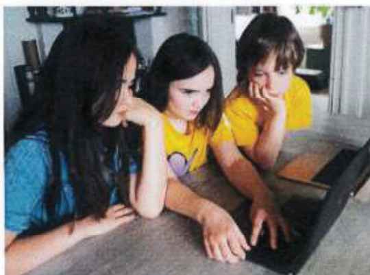
Digital kodeklubb

Våren 2020 utviklet vi konseptet, og før sommeren lanserte vi et utvalg av Lær og lage aktiviteter, digital Kodeklubb, Trylletriks og Klovning.