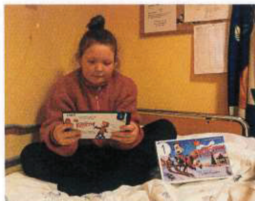
Nettbrett med premiefilmen Jul på Ku-toppen.

Konseptet med nettbrett fylt med godt innhold til glede for innlagte pasienter er noe stiftelsen vil videreutvikle i 2021.