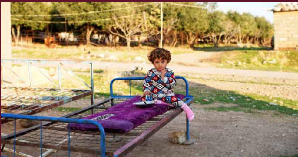
Et barn spiser ris etter en distribusjon i Kurdistan, Irak.