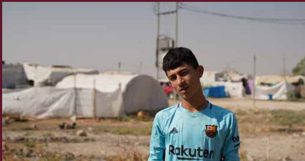
Bellind, 17 år. En av de som kan forsørge familien pga jordbruksprosjektet i Kurdistan.