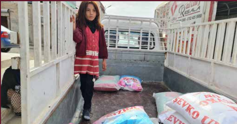
En jente under distribusjon av mat i Kurdistan i november 2020.