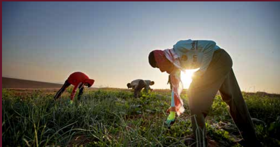
Ansatte på et jordbruksprosjekt i Kurdistan høster grønnsaker