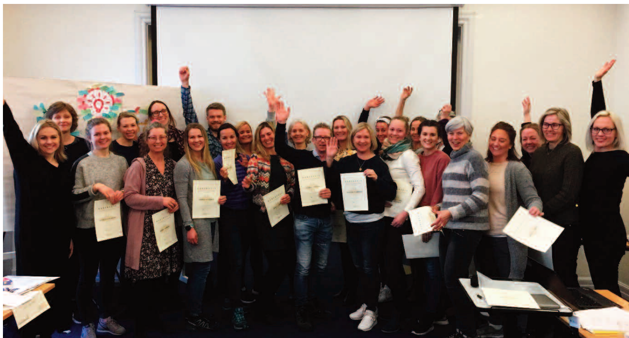
Første kull med kursledere i Hverdagsglede. Tolv frisklivssentraler deltok, med tilsammen 28 kursdeltagere.