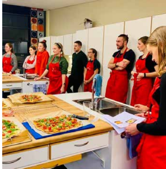
Gode vaner bør etableres tidlig. I prosjektet Dig In lærer unge å lage smart mat – sunt, godt og rimelig.

foreningenes tilbud om språktrening for innvandrerkvinner. I desember 2019 fikk vi tildelt midler fra Stiftelsen Dam for å utvide tilbudet om flerkulturell doula til Bergen, Stavanger og Kristinasand. Det jobbes også for å sikre en bærekraftig finansiering.