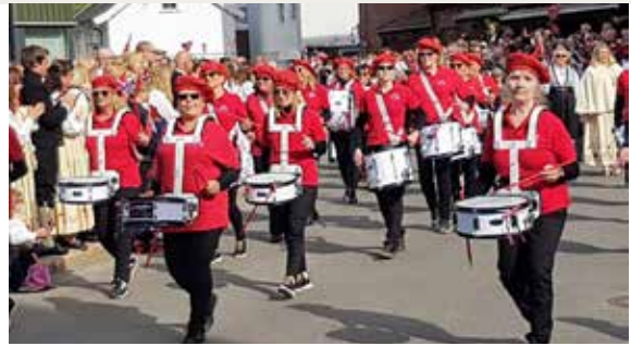
Alle aktiviteter i en forening trenger ikke å gå stille for seg. Å spille trommer er fin felles sosial aktivitet. Hvis mange nok vil så kan man starte eget trommekorps, slik Fjorden sanitetsforening har gjort.