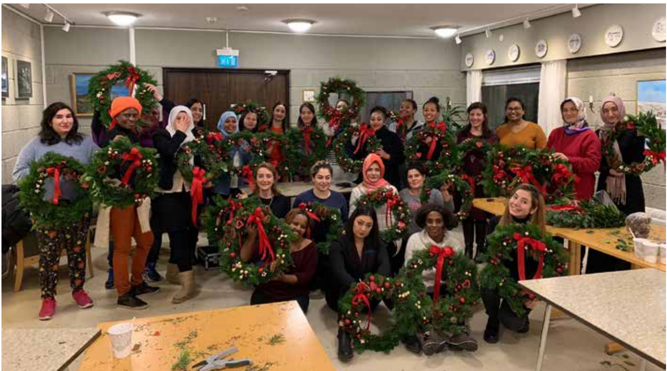
Å inkludere betyr bare at alle skal få være med. De flotteste vinterkranser ble tryllet frem når Ulsteinvik inviterte alle kvinnene til kransbinding.