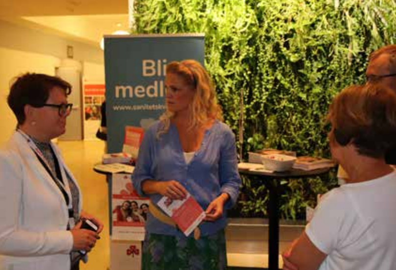
Beredskapsminister Ingvil Smines Tybring-Gjedde viste stor interesse for Sanitetskvinnenes arbeid da hun var en av flere foredragsholdere på Fellessamlingen på Fornebu.