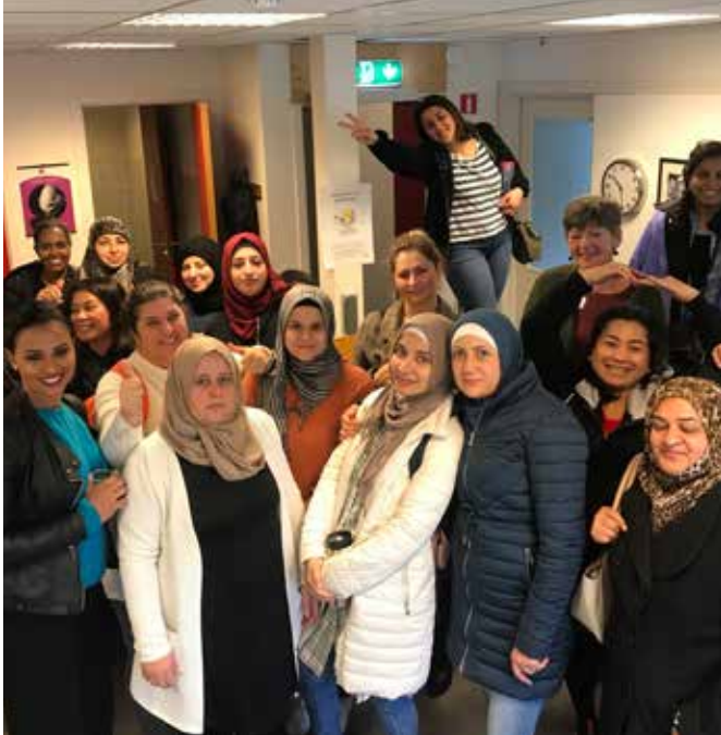
Lørenskog sanitetsforening er en av flere som har arrangert kvinnehel-sedag for minoritetskvinner med fokus på livmorhals kreft, koblet opp til Kreftforeningen sin #sjekkdeg-kampanje.