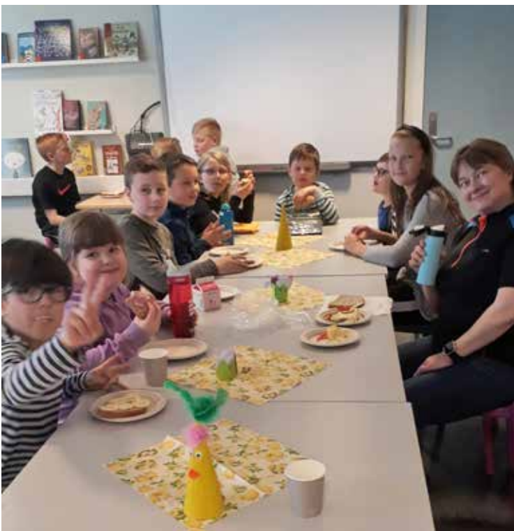
Sanitetskvinner har lange tradisjoner for å være opptatt av at barn får kunnskap om sunn mat. Her er har Sandstad sanitetsforening laget en egen vri med påskefrokost på Strand skole.