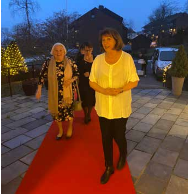
Maten smaker best i godt lag, og derfor inviterer lokale sanitetsforeninger eldre på middag under tittelen: «Kanskje kommer Kongen». Her var det invitert til middag på N.K.S. Grefsenlia.