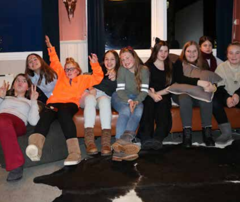
Det går livlig for seg når jentene møtes i Sisterhood-gruppa til Østensjø sanitetsforening.