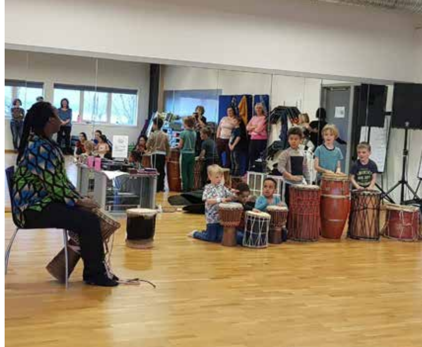
Med midler fra Tryg ble det rytmer og dans når Sauda sanitetsforening hadde workshop.