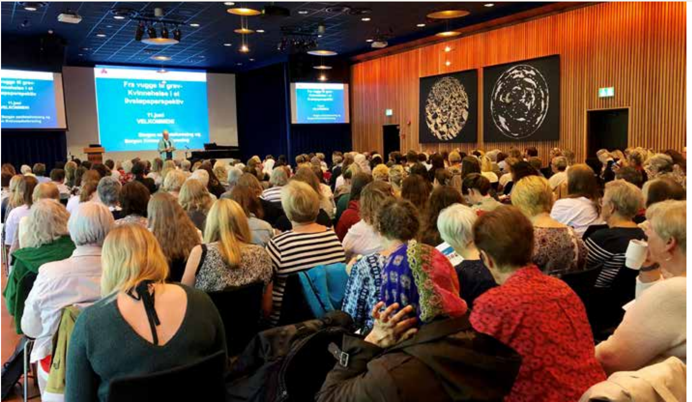
Sammen arrangerte Bergen sanitetsforening og Bergen Kvinnesaksforeningen kvinnehelsekonferanse med tittelen fra Vugge til grav.