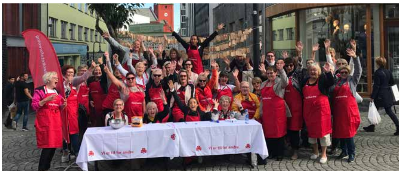
Rundt 500 damer iført røde forkler med #Jeglikerdeg inntok Lillestrøm, Narvik, Molde, Kristiansand og Stavanger (bildet).