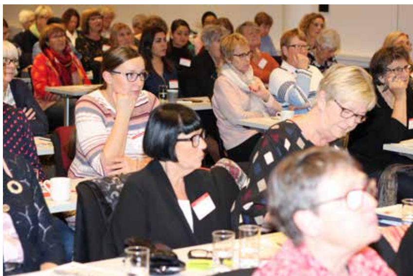
I løpet av året har Sanitetskvinnene flere møtearenaer for påfyll av kunnskap og inspirasjon. Her fra integreringsseminar på Gardermoen i fjor høst.