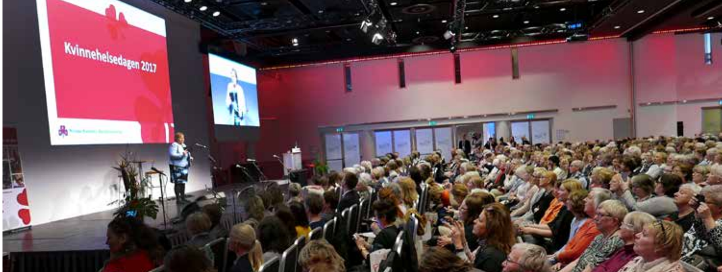
Foran 1400 damer benyttet statsminister Erna Solberg Kvinnehelsedagen til å takke Sanitetstkvinnene for innsatsen de har gjort og gjør for å sikre velferdssamfunnet.

på videregående skoler og snakker med russen om viktigheten av samtykke til sex gjennom kampanjen Ja betyr ja. I 2017 lyktes vi for første gang å arrangere skolebesøk for russen over hele landet og nådde ut til rundt 9000 russ gjennom skolebesøkene. I tillegg hadde vi en storstilt kampanje i sosiale medier, der bl.a. skuespillerne fra den prisbelønte tv-serien for ungdom, SKAM, stilte opp som Ja betyr ja-ambassadører.