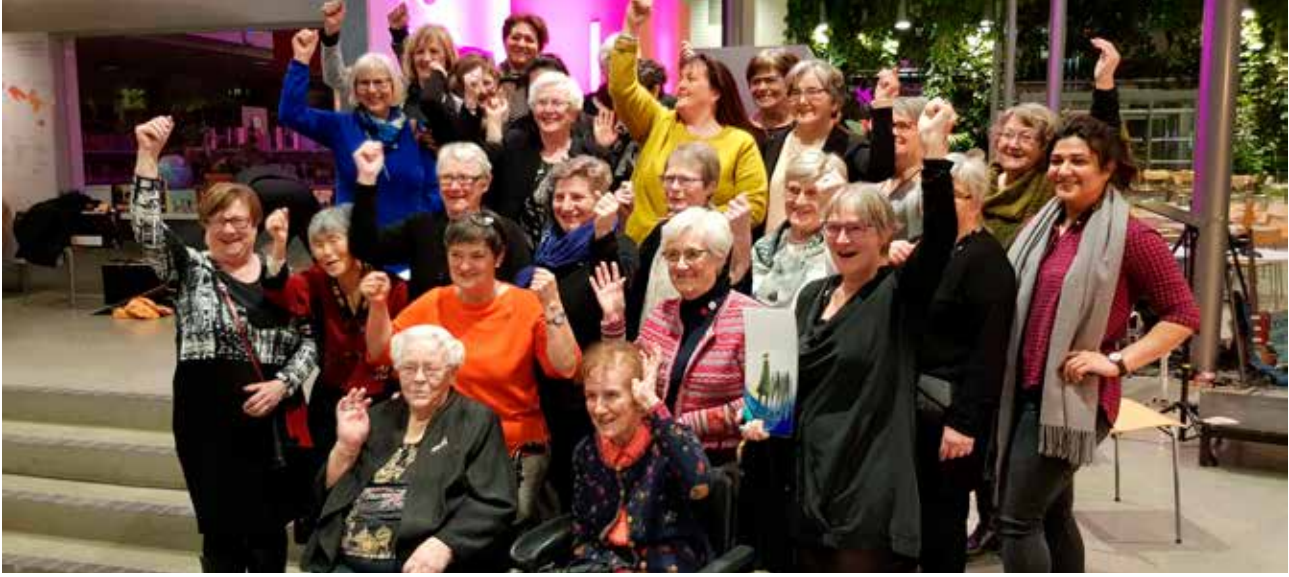
Frol Sanitetsforening mottok Levanger kommune sin Frivillighetspris for sitt virke i kommunen gjennom 111 år.

ekstra aktiviteter som sykurs, svømmetrening, språkkafeer og strikkekafeer. Tilbudet er etablert ca. 80 steder i Norge.