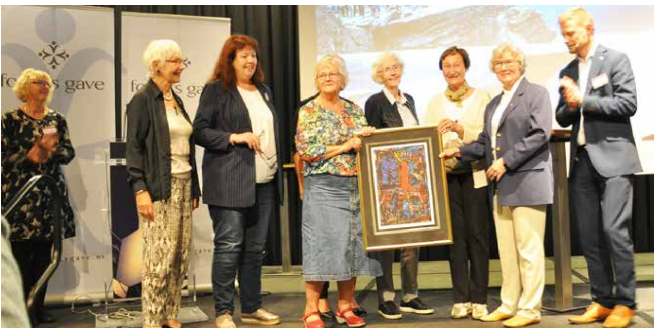
Haugesund Sanitetsforening mottok Folkets Gaves ærespris, som ble overrakt av helseminister Bent Høie, for sitt arbeid for Revmatismesykehuset.

Språk er en viktig nøkkel, også til yrkeslivet. Sosialt samvær forebygger ensomhet, bidrar til nettverk og mestring og styrker både fysisk og psykisk helse. Derfor er språkpraksis også godt for kvinnehelsen. Dette gjøres gjennom basisaktivitetene Språkvenn. Her inviterer Sanitetskvinnene minoritetskvinner inn i sine ulike aktiviteter og kvinnefellesskap, og mange har etablert