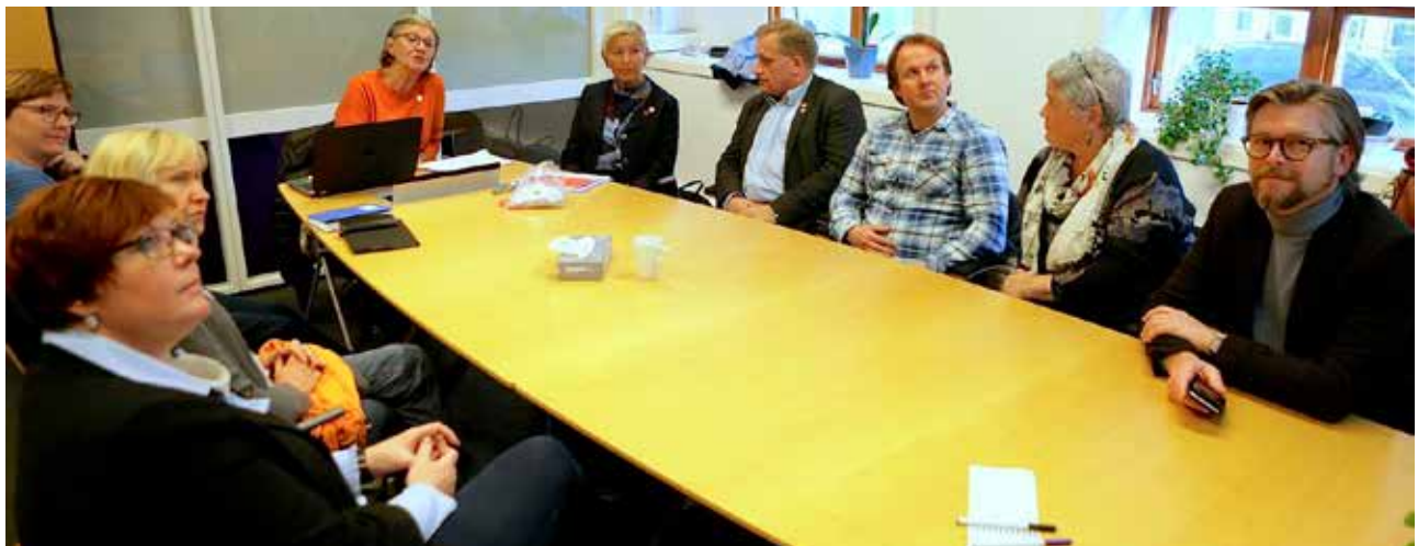
Unge jenter skal ikke få påvirket synet på eget utseende ved å sammenligne seg med kvinneidealer som skapes ved å manipulere modellene i Photoshop. Dette er en sak som N.K.S. jobber med både nasjonalt og lokalt. Sandnes Sanitetsforening møtte i november kommunens representanter med krav om at det på Sandnes blir retusjertfri sone, der kommunen eier utstillingsflaten.

Sanitetskvinnene er også opptatt av hverdagsberedskapen, og er derfor stolte over å være en del av den nasjonale førstehjelps-