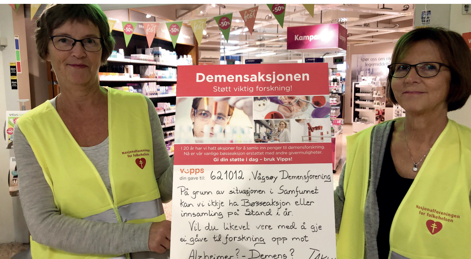
Det ble en annerledes Demensaksjon i 2020, der lokallagene fikk testet digitale innsamlingsmetoder, slik som Nasjonalforeningen Vågsøy demensforening.

Demenspriser ble delt ut av 15 fylkeslag og 16 fylkeslag delte ut Folkehelsepris. Lokallagene sprer også informasjon gjennom åpne møter, samtalegrupper og i tilknytning til pårørendeskoler.