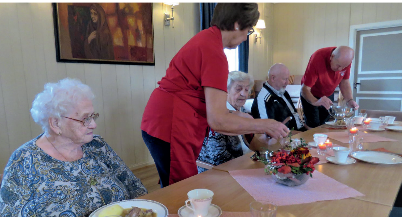
I årets nyttårstale berømmet statsminister Erna Solberg frivillighetens innsats for eldre og ensomme under pandemien og trakk fram helselaget på Ytterøya og deres nydelige arrangementer for eldre i bygda.

Koronapandemien har bidratt til kreativitet, nytenkning og digitalisering av organisasjonen, men har også vært et stort hinder for normal aktivitet. Når hverdagen er tilbake, blir det en viktig oppgave å remobilisere medlemmer og få i gang de lokale aktivitetene igjen. Det er en utfordring, men etter alt vi har klart å få til i dette spesielle året, har vi stor tro på at vi skal klare dette også.