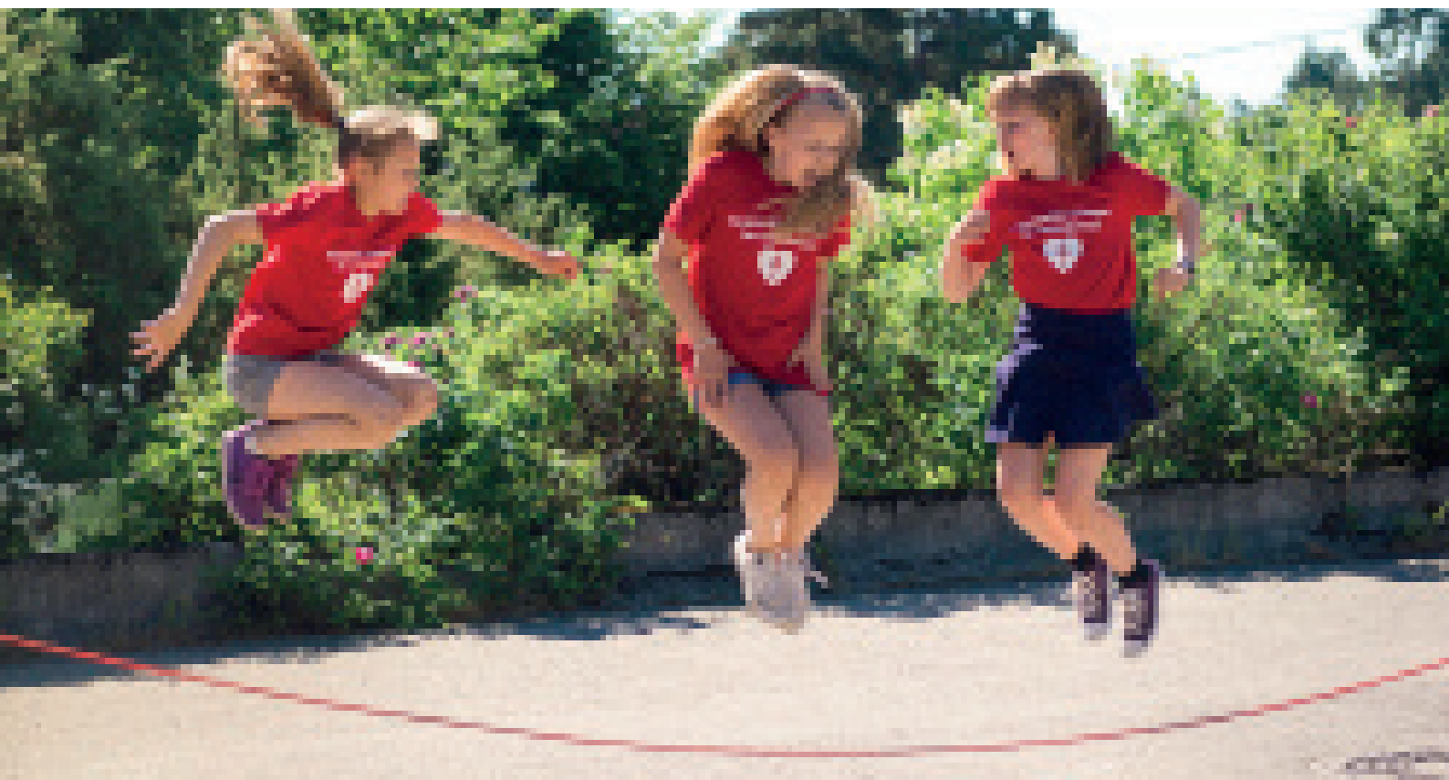
Årets hoppetaukonkurranse ble tilpasset hjemmeskole og karantene, med tips til hopping både med og uten hoppetau.

Gjennom hele året ble situasjonen for personer med demens og pårørende under pandemien ble fulgt opp tett overfor helsemyndigheter og media. Vi utførte en spørreundersøkelse blant egne medlemmer som resulterte i en rapport om demens og korona.