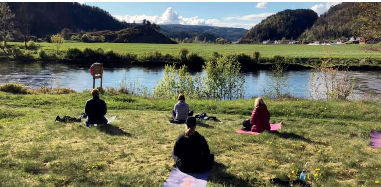
Mange gode løsninger for å overholde smittevernreglene dukket opp. Nasjonalforeningen Øyslebø helselag flyttet yogatimene sine utendørs.

Gjennomføringen av den årlige lokallagsmarkeringen, Hjertheuka, og hoppetaukonkurransen ble også, til tross for god påmelding, preget av pandemien.