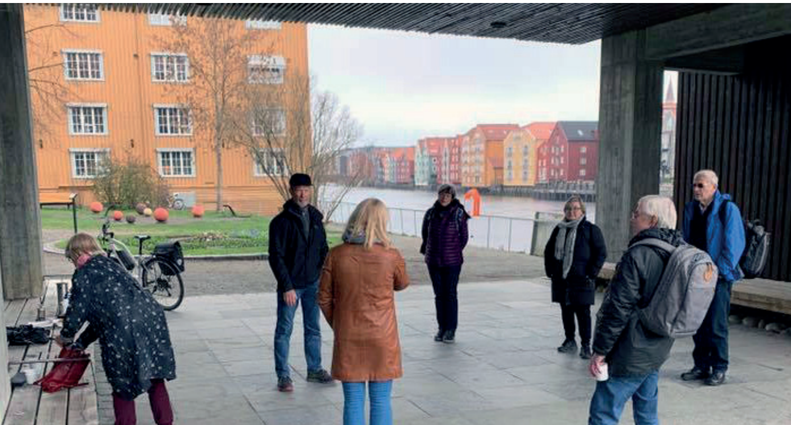
Koronapandemien førte til at mange lokallag måtte tenke litt nytt. Nasjonalforeningen Trondheim demensforening holdt sitt første styremøte på våren utendørs - under bybroa i Trondheim.

Vårt helsepolitiske arbeid omfatter også styrking av frivillighetens kår, blant annet