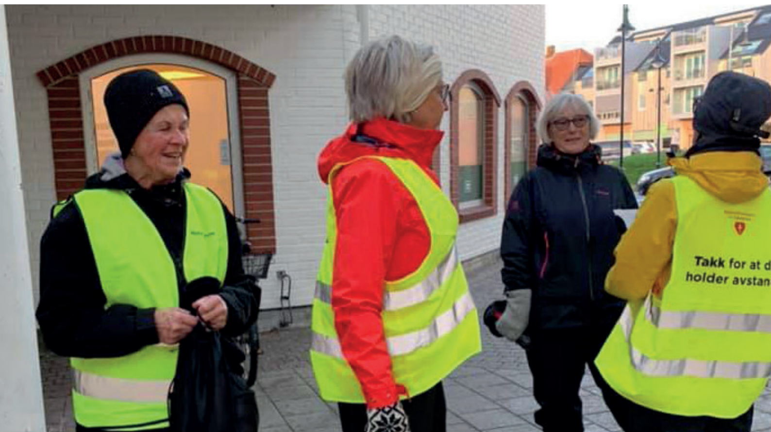
Nasjonalforeningen Randaberg helselag var ett av mange lokallag som opprettholdt gågrupper gjennom hele året, med gode smitteverntiltak.

Kontantstrømmen til organisasjonen gjenspeiler i stor grad inn- og utbetalinger