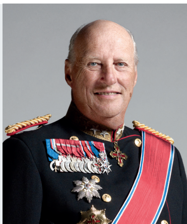
H. M. Kong Harald V Nasjonalforeningen for folkehelsens høye beskytter

Forsiden: Nasjonalforeningen Ytterøy helselag flyttet skolelunsjene ut under koronaen.