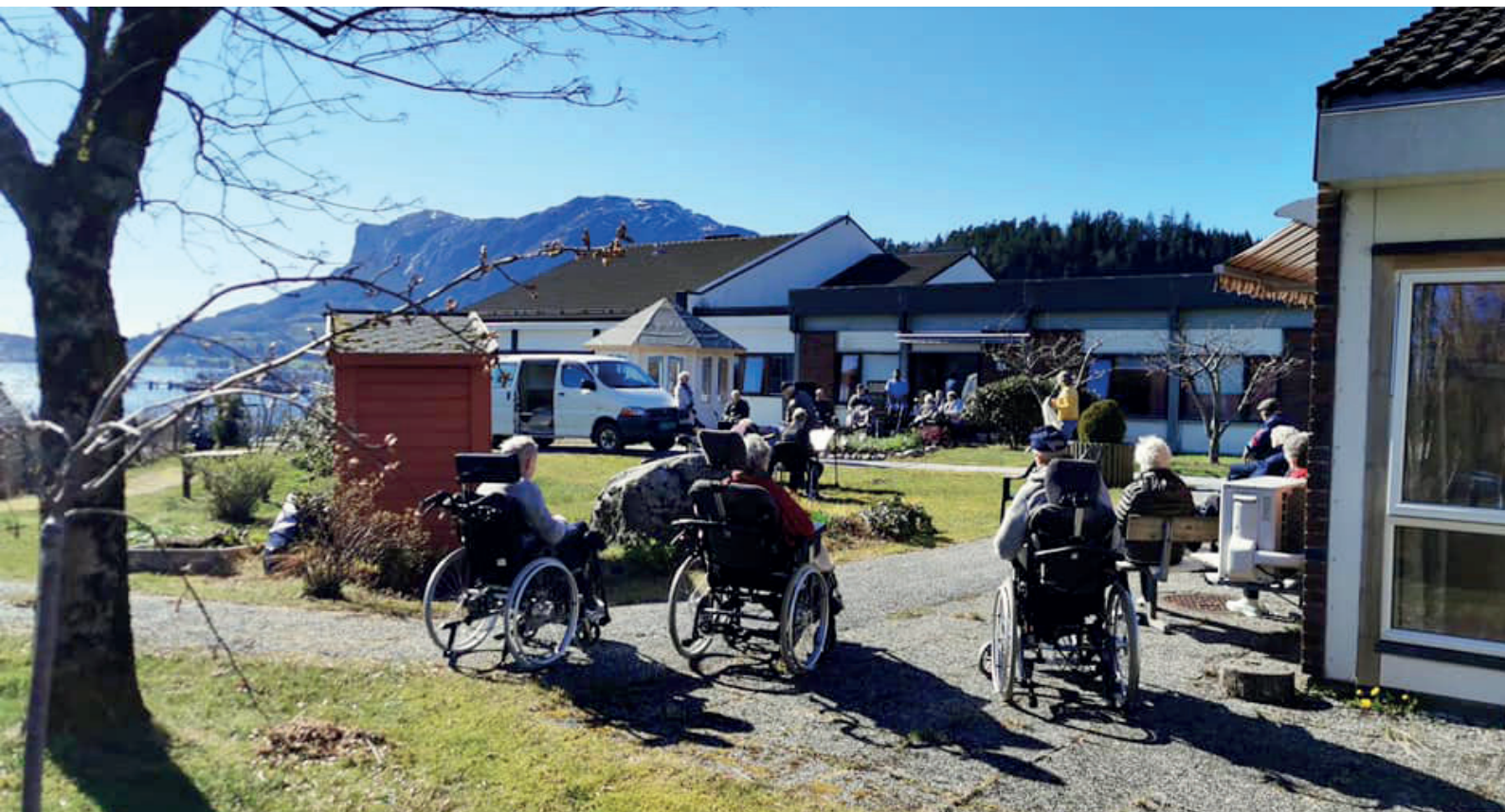
Nasjonalforeningen Nordre Askvoll helselag arrangerte utekonsert for beboerne på Askvollheimen, med god sosial avstand mellom publikum.

Nasjonalforeningen for folkehelsens regnskap er satt opp i samsvar med regnskapsloven av 1988 og i henhold til regnskapsstandarden NRS(F) God regnskapsskikk for ideelle organisasjoner.