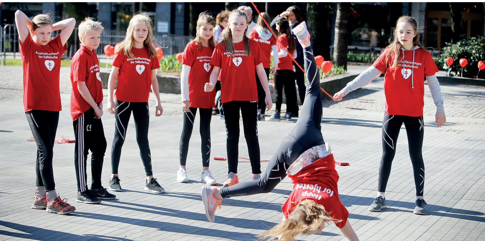
Årets hoppetaukonkurranse samlet over 100 000 barn fra over halvparten av landets skoler. Målet med konkurransen er å vise at fysisk aktivitet både er morsomt og bra for helsen, og fint kan kombineres med fag og undervisning.

Hovedårsaken til økningen har vært flere langtidssykemeldte ansatte, som for øvrig utgjorde 5,84 prosent. Sykefraværet er likt med landsgjennomsnittet på 6,2 prosent.