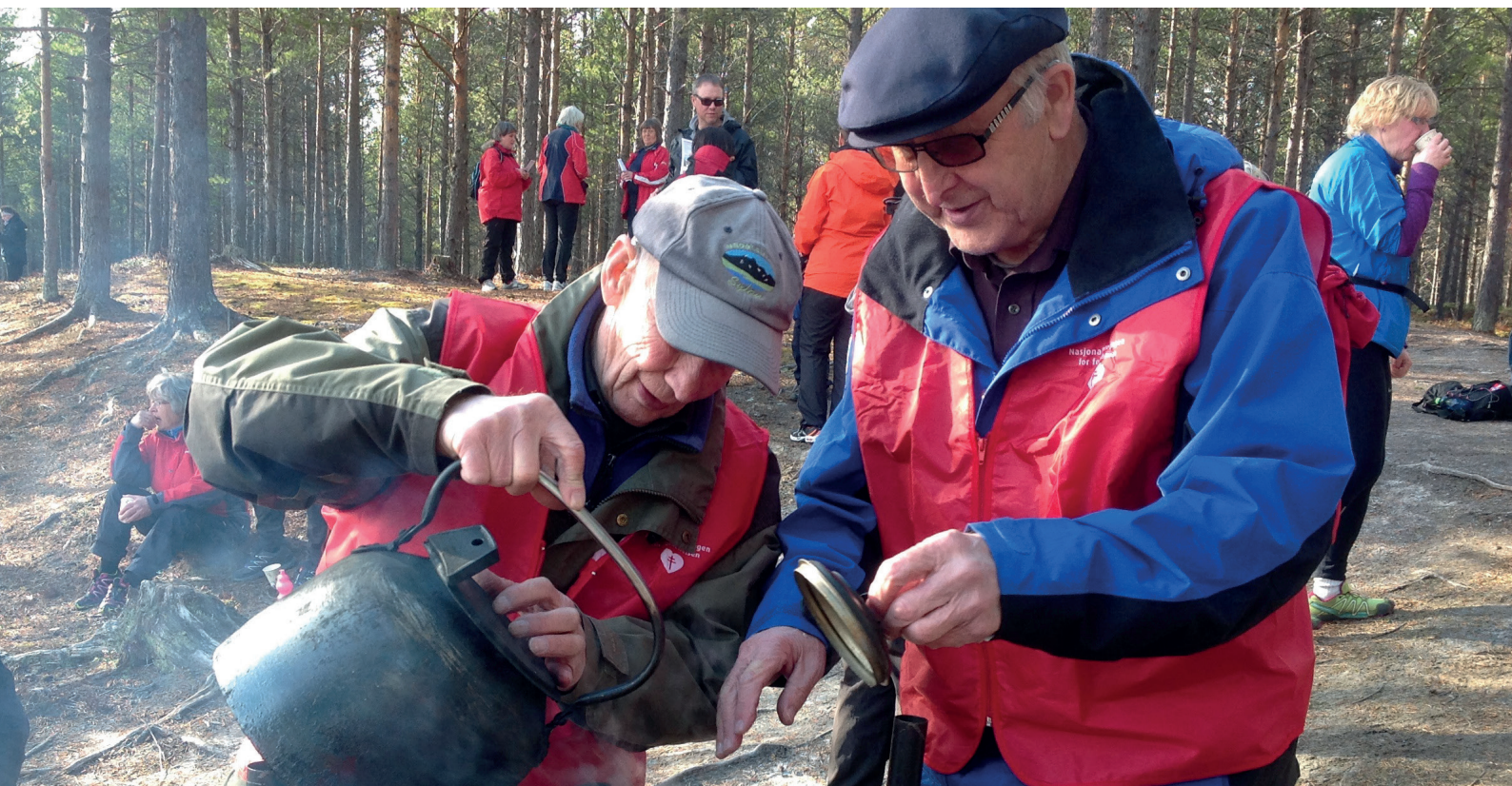
Nasjonalforeningen Røros og Holtåsen demensforening er en av flere demensforeninger som arrangerer hjertemarsj. Hjertequiz, servering av kaffe, saft og kake, og muligheter for grilling ved Gapahuken er faste innslag.

Nasjonalforeningen for folkehelsen er opptatt av at grunnlaget for gode