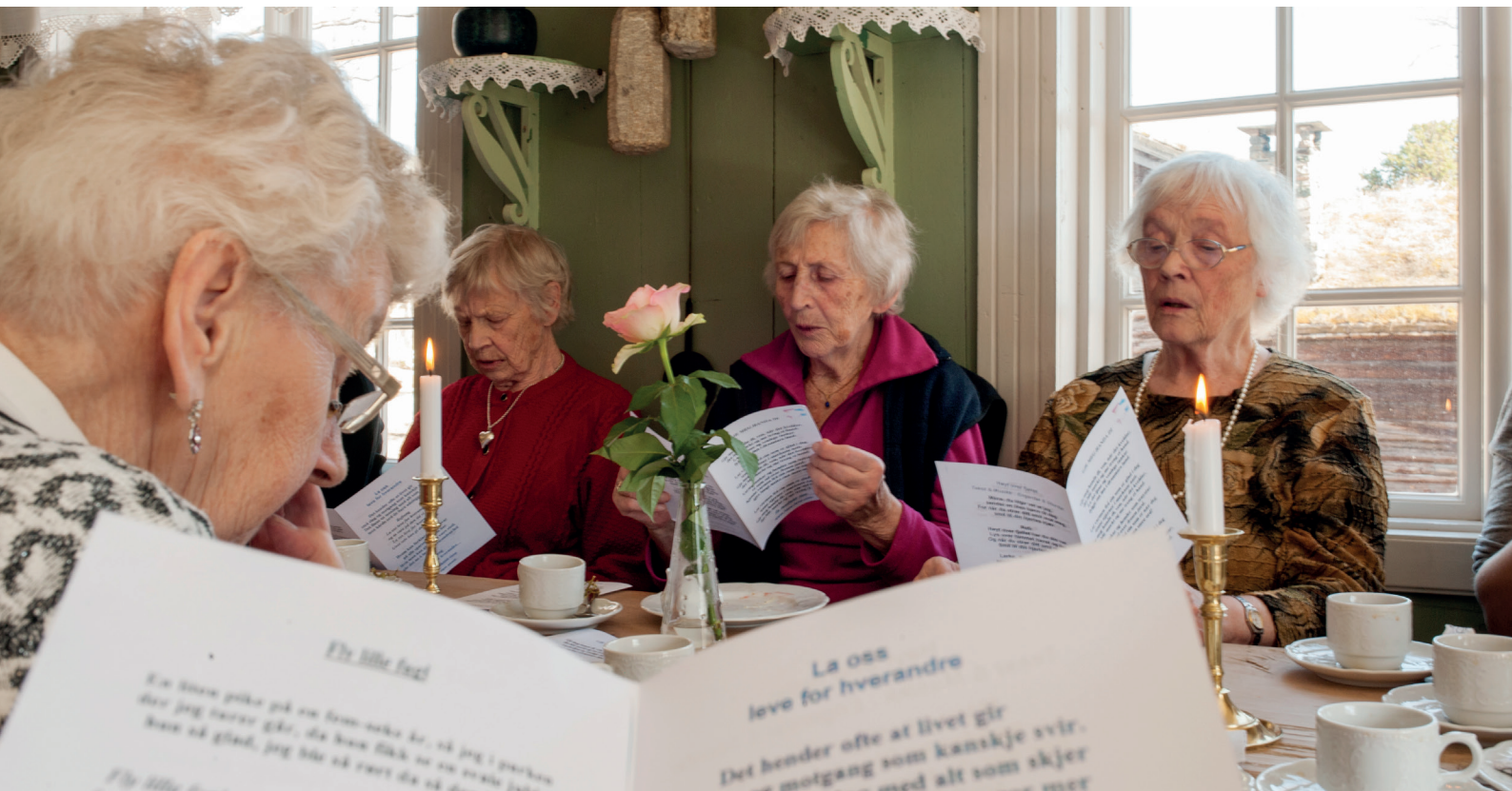
Nasjonalforeningen Oppdal demensforening inviterer jevnlig til erindringstreff i det som en gang var tingstua i Oppdal. Regler, rim, sang og prat skaper smil og latter, og bringer minnene nærmere.

Organisasjonen bidrar med sin frivillige innsats, både på folkehelseområdet