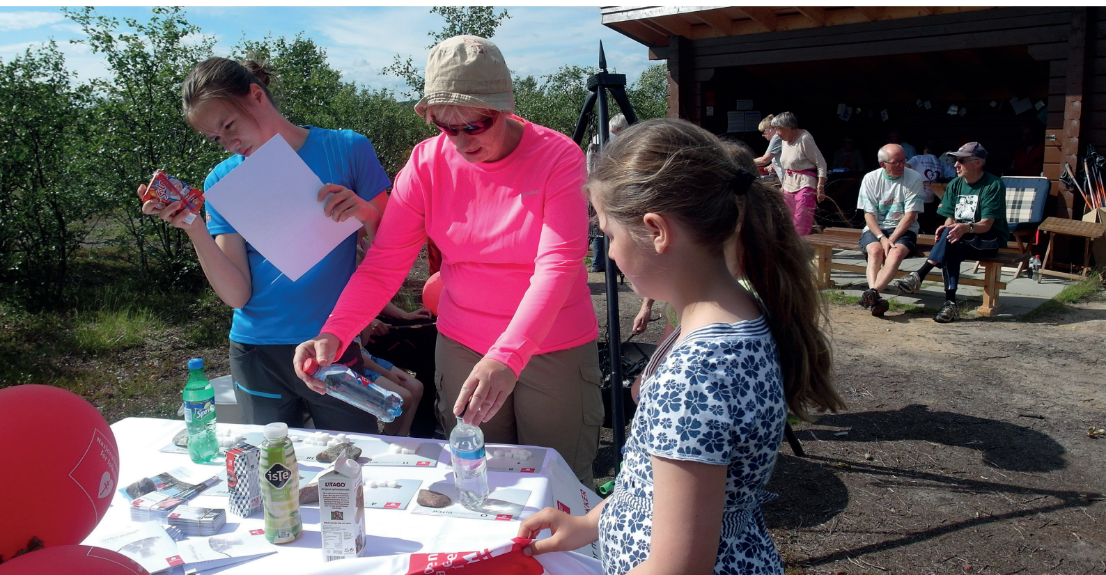
Hjertemarsjen i Neiden, også kalt Laksemarsjen, ble en stor suksess med nesten 100 deltagere. I mål var det sukkerquiz og servering av laksesuppe, med akkompagnement av trekkspillmusikk.

Nasjonalforeningen for folkehelsens Demenslinje besvarer spørsmål om demens, og mottok i løpet av året 3 023 henvendelser, fordelt på 2 498 henvendelser på telefon, 266 på e-post og 259 på chat. Demenslinjen ble støttet med 1,5 millioner kroner over statsbudsjettet, og vi mottok også 2,4