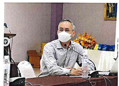
Bildetekst: Bilder fra markeringen av starten på medical mission ved Chonburi Hospital i Chonburi province i Thailand, august 2022.