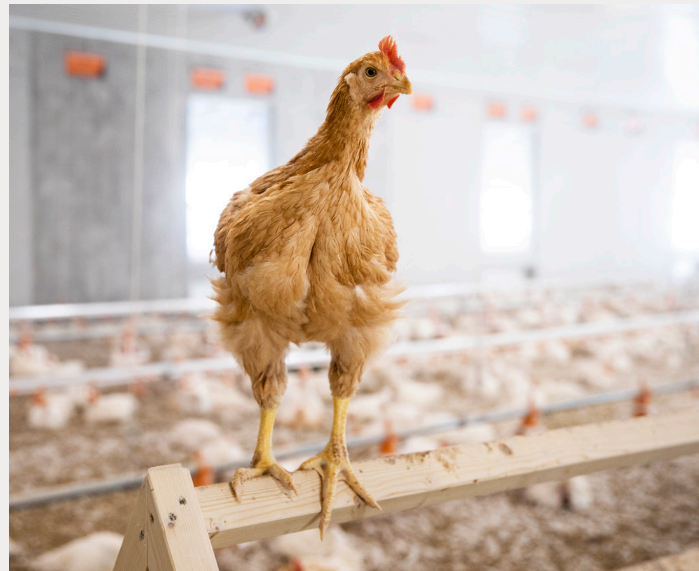
Kylling på en gård sertifisert med Dyrevernmerket.

Dyrevern Viten gir deg forskning, politikk og næringslivsnyheter, og er for personer som arbeider med dyrevelferd på ulike måter. Viten utgis to ganger i måneden og går ut til over 4.000 personer.