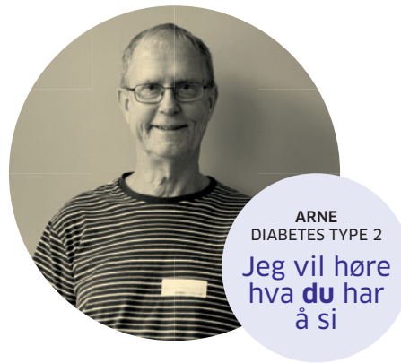
ARNE DIABETES TYPE 2 Jeg vil høre hva du har å si