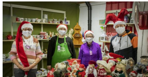
Vi klarte å avvikle årets juleloppis med gode smittevernrutiner

2020 ble preget av pandemien, og det meste av aktiviteter i organisasjonen ble påvirket. Hjemme i Norge ble først loppemarkedet rammet og måtte stenge i perioder, samt omsetningen gikk en del ned i første halvår. Festivaler som vi normalt har inntekter fra ble kansellerte, og samfunnet stengte ned. Det var først og fremst frykten for at våre eldre frivillige skulle bli rammet som gjorde at vi var ekstra forsiktige.